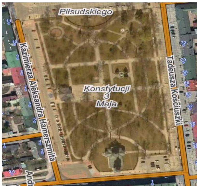
Rysunek 2. Mapa pogładowa Parku Konstytucji 3 Maja.